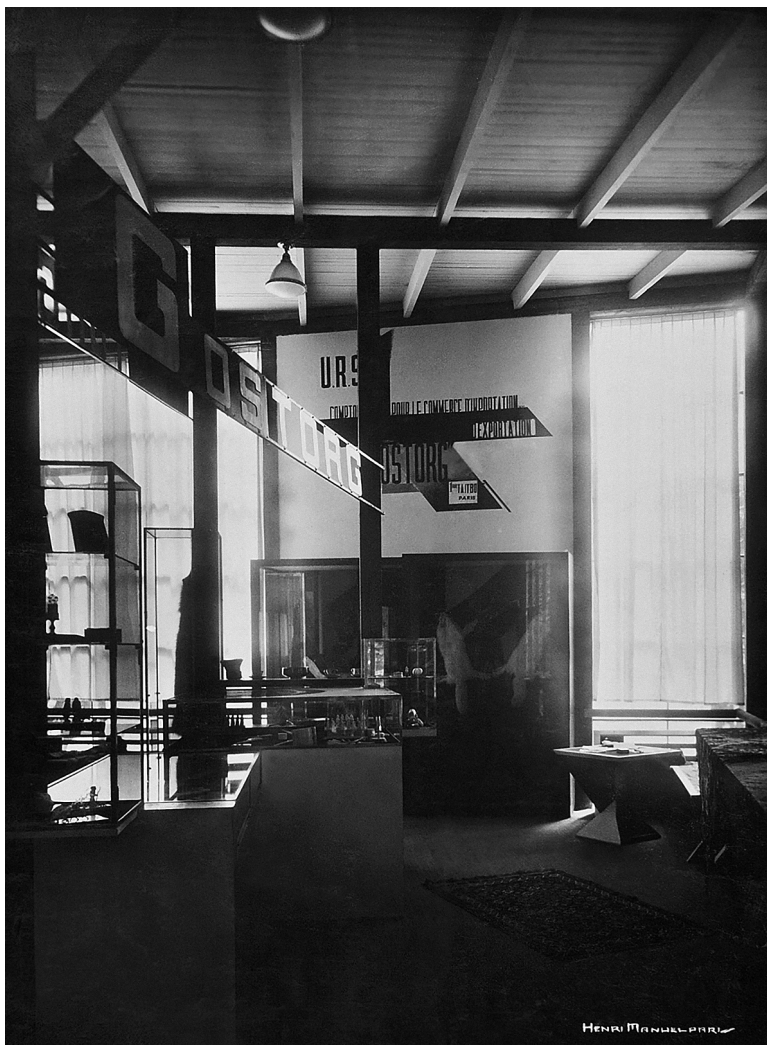
Интерьер советского павильона. Архитектор К.С. Мельников. Второй этаж. Экспозиция Госторга. Проект экспозиции А.М. Родченко. 1925 г.